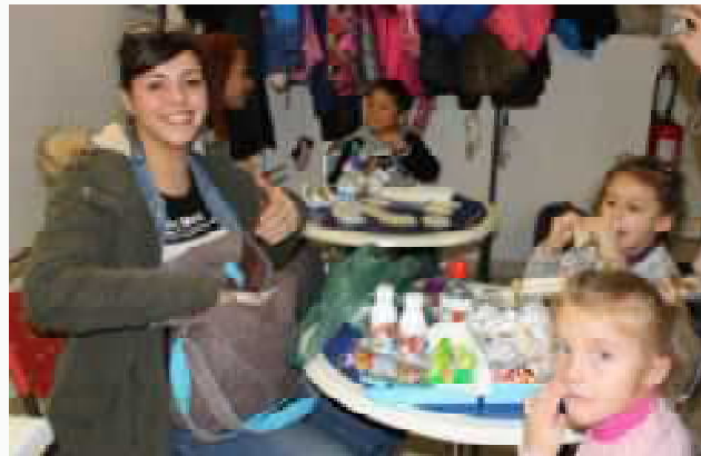
Le pique nique, un moment très attendu