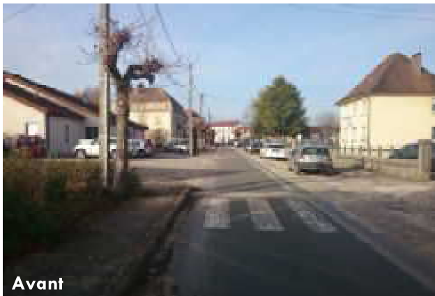
Accès aux écoles