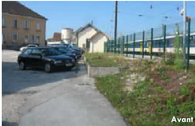
Accès au collège