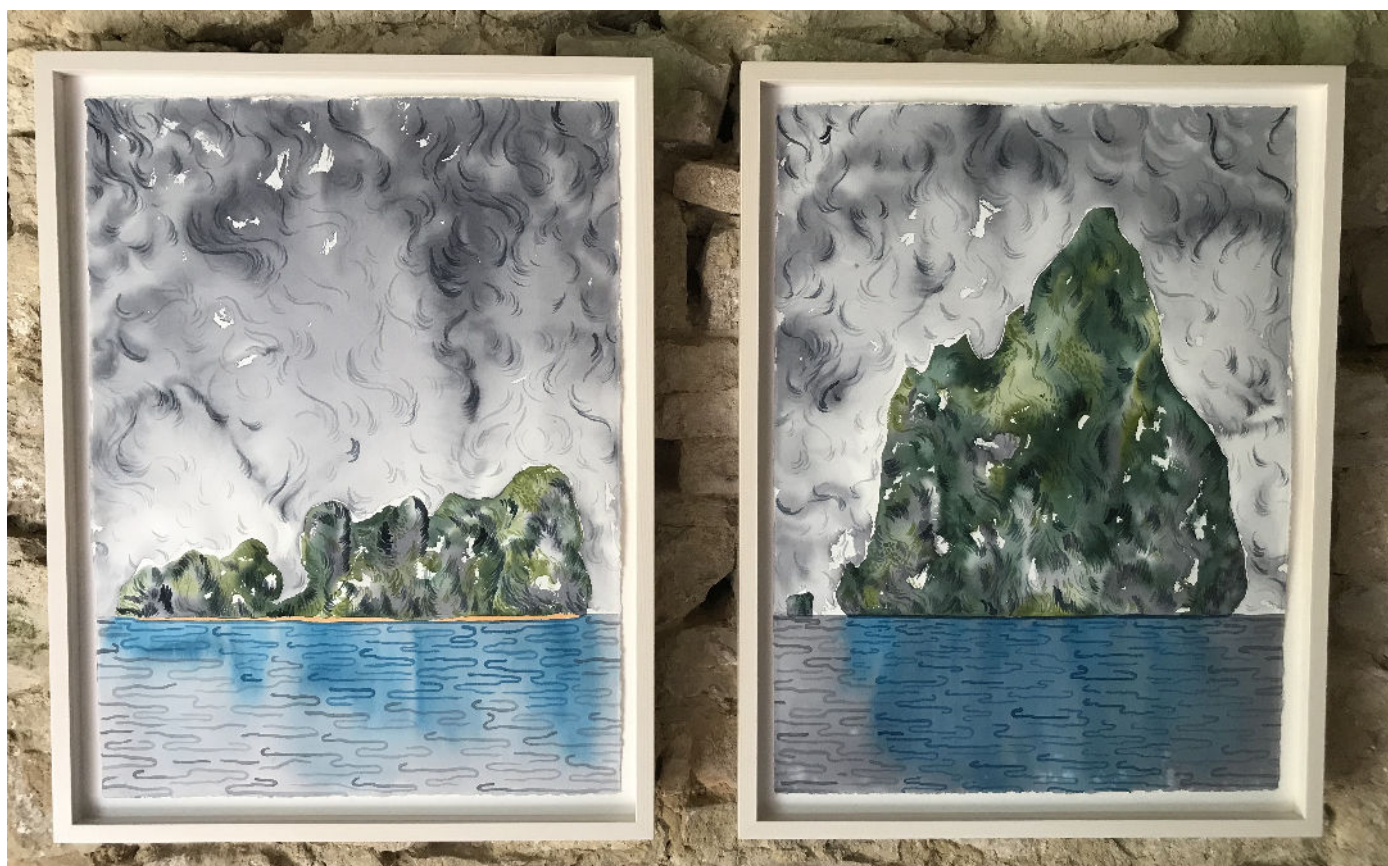
Aquarelles réalisées par l'artiste Suisse Sébastien Strahm et exposées à la chapelle Saint-Roch de Cessay du 5 juillet au 23 août