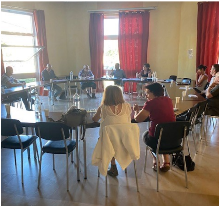
Premier Conseil d'Administration du C.C.A.S de Frasne le 09 juillet 2020