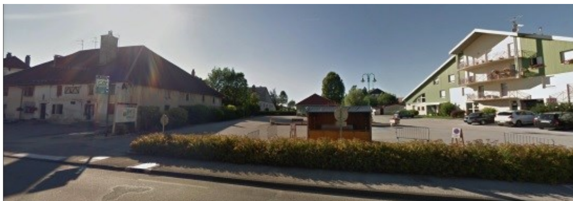
Vue aérienne au stade faisabilité

que des dossiers de subvention importants. Par le biais d'une mission « assistance à maîtrise d'ouvrage », la Communauté de communes Frasne Dugeon prévoit, d'ici à la fin 2020, un recrutement d'architecte pour la construction. Passé la période difficile du printemps et le renouvellement des élus locaux, le dossier est donc remis en avant pour progresser, nous l'espérons, rapidement, y compris en envisageant des solutions transitoires afin de pouvoir accueillir un jeune médecin si le cas se présente.