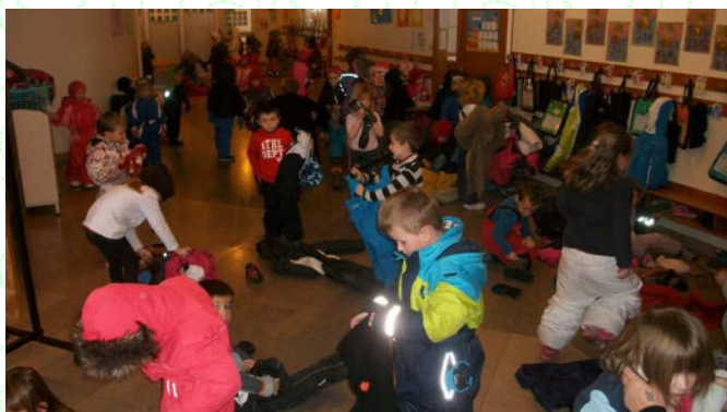
Branle-bas de combinaisons ! On s'étale, on enfle, on se pare contre le froid et on glisse sur les flocons.