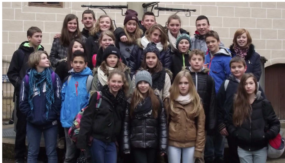
Photo de groupe prise devant le château de Tübingen.

- Le dimanche, les élèves sont restés dans les familles avec leurs correspondants respectifs.