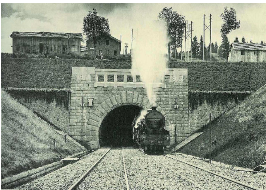
Souterrain du Mont d'Or (Tête côté France)

Communication / Sponsoring Aude Simon-Curot curotaude@yahoo.com