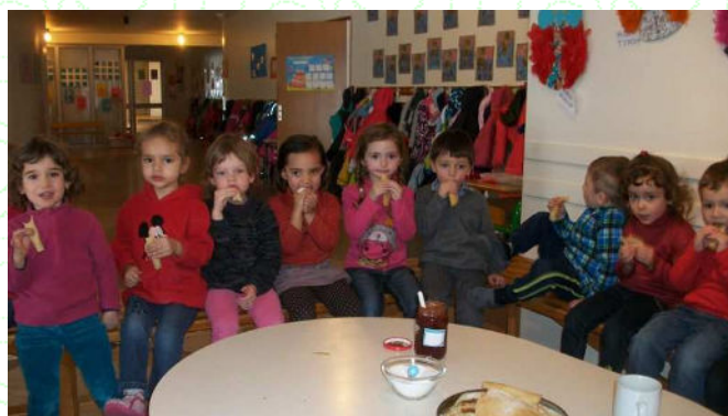
2 février, jour de la Chandeleur. Les crêpes, c'est trop bon !