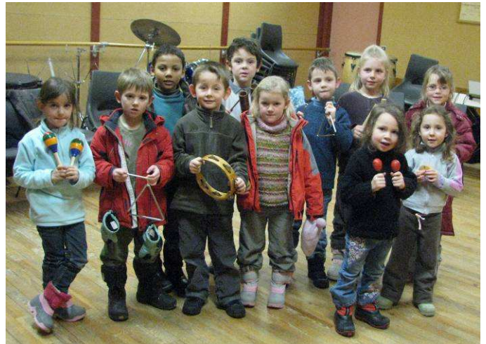
Le groupe éveil musical des 5-7 ans