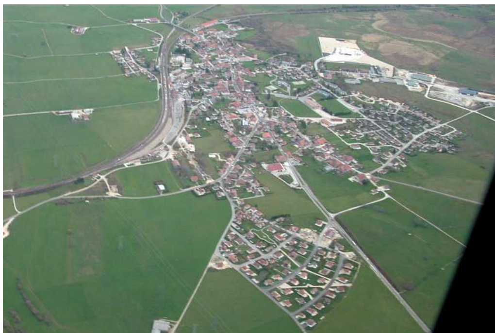
Vue aérienne de Frasne (2005)