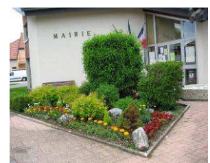
Entrée de la mairie

« IL S'AGIT D'UNE RÉFLEXION PORTÉE SUR LE MOYEN ET LE LONG TERME, SERVANT À ANTICIPER NOTRE DÉVELOPPEMENT AFIN DE MIEUX LE MAÎTRISER »