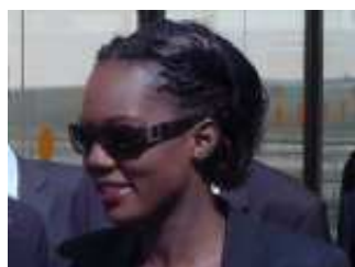
Rama Yade en gare de Frasne