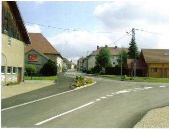
Entrée fleurie de Frasne

La première tâche a été de terminer la réfection de la rue de l'Étang : importants travaux qui consistaient en l'assainissement avec réseaux séparatifs, l'enfouissement des réseaux secs, le recalibrage de la chaussée, la réfection totale des trottoirs.