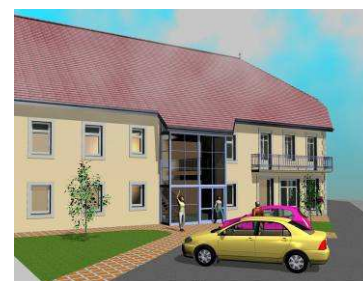
Le projet Espace Poix