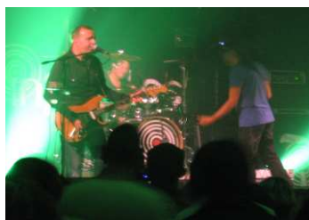
Les Infidèles sur scène.