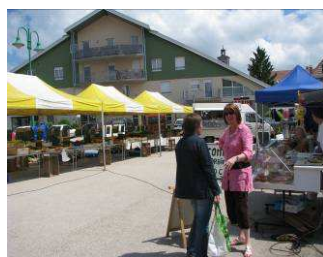
Le marché place Rouy

Bienvenue Ô QUARTIER BOIS Pôle bois de FRASNE, un concentré de savoir-faire