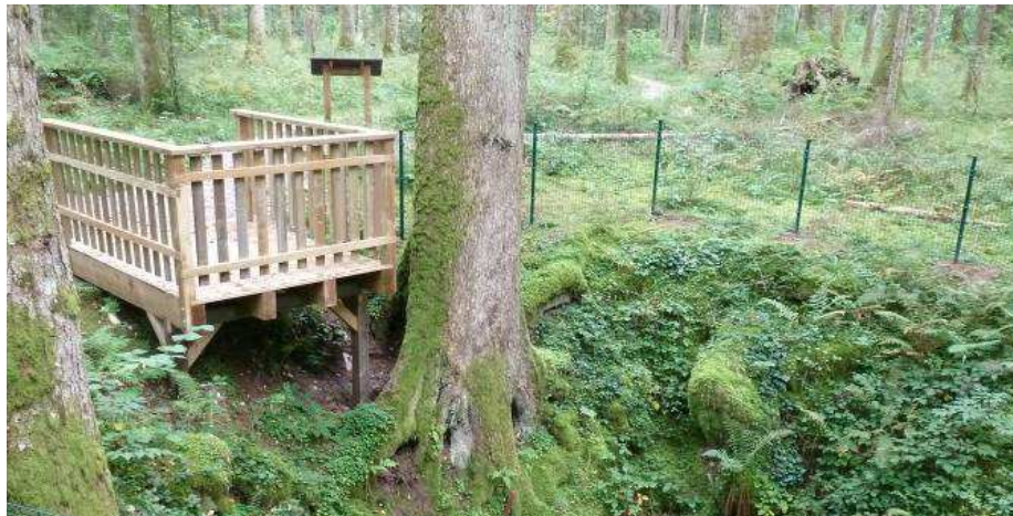
Le ponton permet de s'approcher du sapin sans danger

Cependant, le site restait sans protection. La doline profonde d'environ 8 m