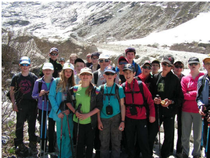
Le lendemain, randonnée au glacier du Trient