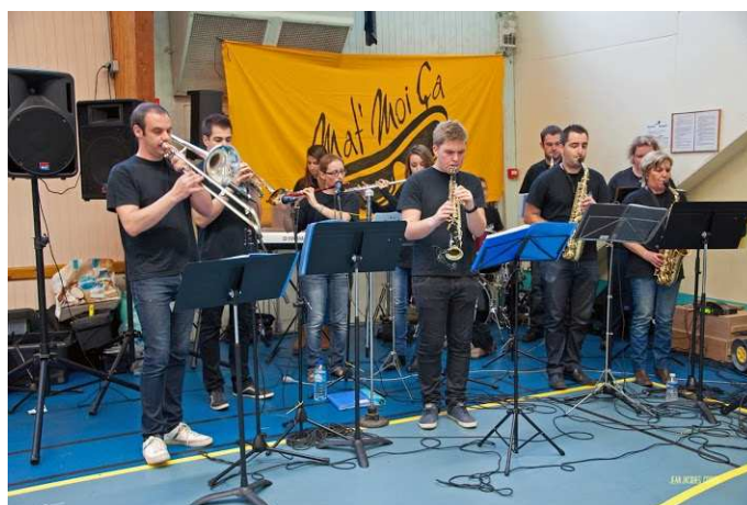
Le groupe les « Mat Moi Ça » ont offert une belle prestation !!