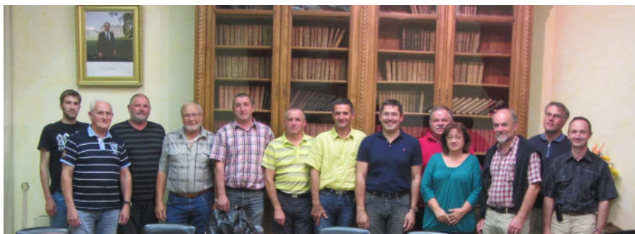
Le comité d'organisation franco-suisse.

Début septembre s'est tenue à Frasne la deuxième réunion de préparation à la célébration du 100 ème anniversaire de la liaison Frasne – Vallorbe. Elle a permis de valider la forte implication des cinq communes desservies par le chemin de fer et qui travailleront de concert pour la réussite du projet: Frasne, Vallorbe, Vaux et Chantegrue, Labergement