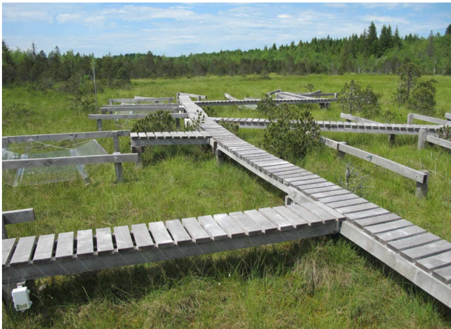
La station « Peat-Warm » de Frasne est mondialement connue

Dans une tourbière, les plantes fixent le carbone présent dans l'air par photosynthèse.