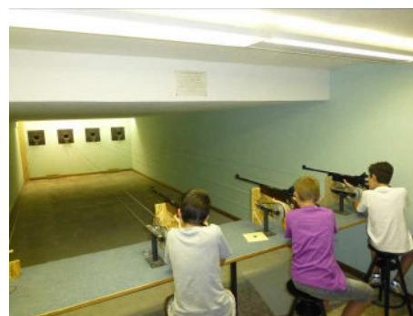
Séance de tir à la carabine

Les 30 ans du ski club, Méga-fondue samedi 2 novembre 19h30 à Frasne