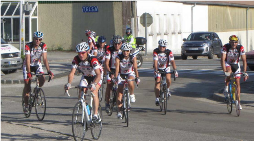
Roulez contre le cancer !

Frasne a accueilli la Ronde De l'Espoir le 7 septembre dernier. Les coureurs ont été reçus en mairie où une collation leur a été offerte. Une subvention de 100€ leur a été également remise. D'autre part, un lâcher de ballons pour la ligue contre le cancer a été organisé lors du marché de Manon. (photo de 1er page)