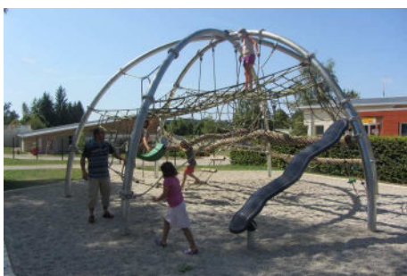
Espace jeunesse de Clairvaux

Notre visite au camping de Clairvaux les lacs en août dernier nous a « éclairés ».