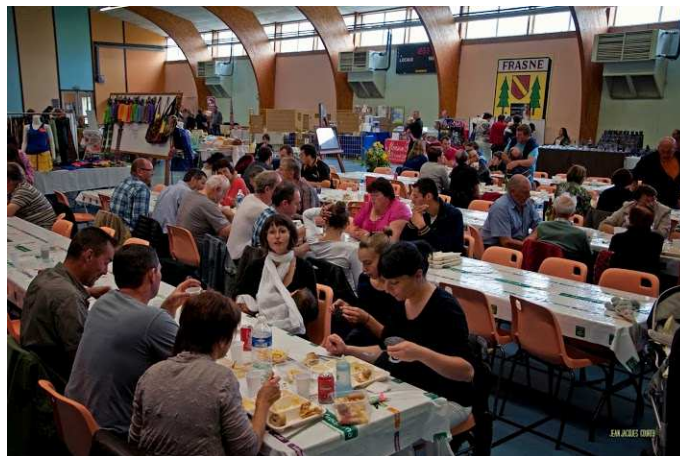
Le menu de l'Auberge du Gaulois a régalé les convives