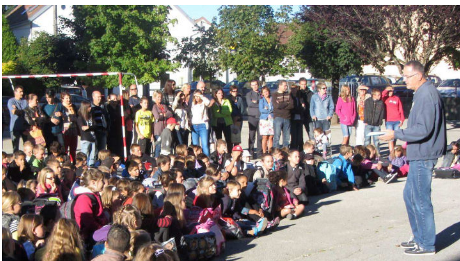
Une année bien remplie en perspective !