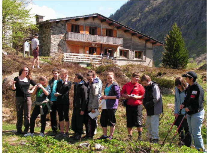
Notre séjour commence par la visite du Chalet de la réserve des Aiguilles Rouges au col des Montets : étude de la faune et de la flore.