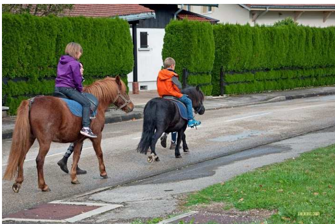
Merci au club hippique de Boujailles qui a proposé des ballades en poney tout au long de la journée.