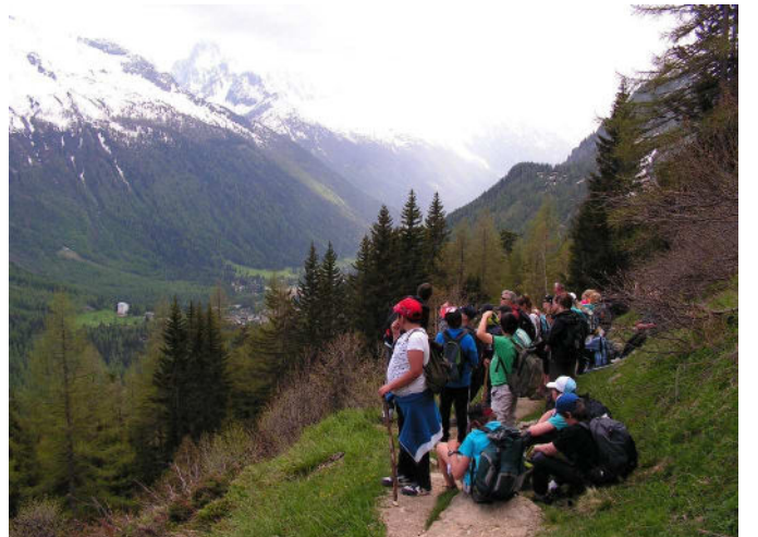
L'après-midi, un accompagnateur nous emmène randonner ; il nous explique les impacts de l'homme sur l'environnement : aménagement de la forêt, l'habitat traditionnel, les stations de ski, construction de paravalanches, canalisation du cours d'eau...