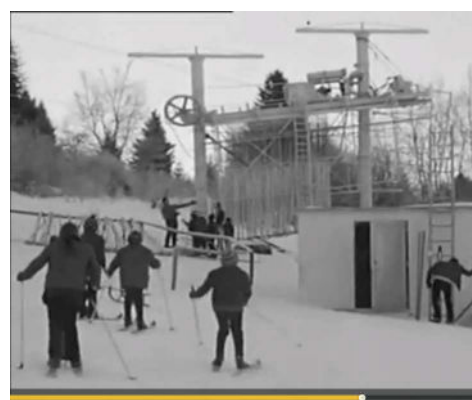
La station de Bonnevaux dans les années 70

Les 30 ans du ski club, Méga-fondue samedi 2 novembre 19h30 à Frasne