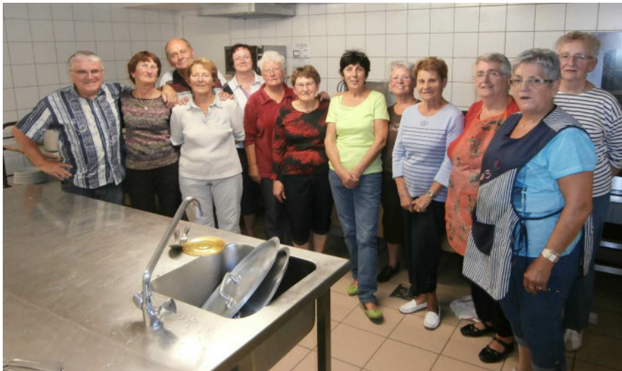
Une équipe de bénévoles toujours prête pour préparer les repas du club.