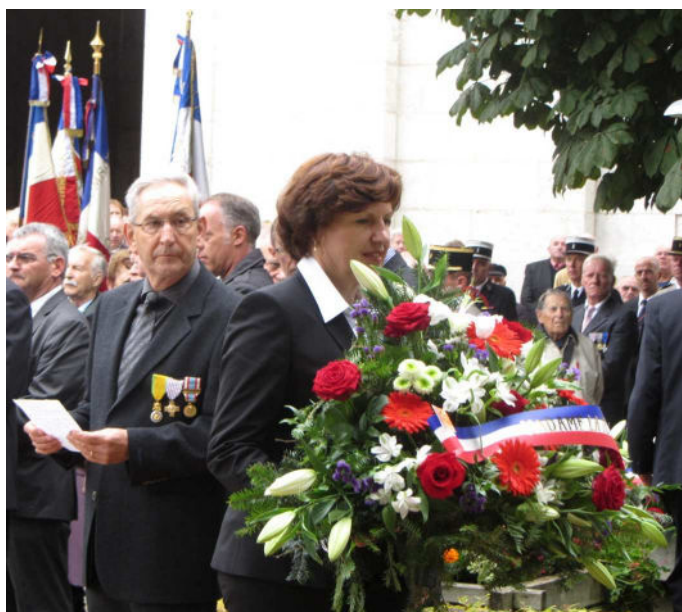
Annie Genevard, Députée du Doubs déposant une gerbe