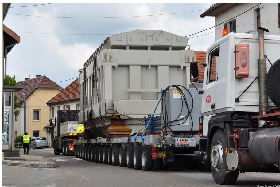
Ce convoi a une masse totale de 270 tonnes

Conçu et reconditionné par Alstom sur le site de Villeurbanne, ce transformateur aura comme fonctions principales d'abaisser la tension de 400000 à 225000 volts pour ensuite injecter cette tension sur le réseau en direction de Champagne, mais également il est prévu pour alimenter le premier transformateur (225000/63000 volts) déjà en place. Ce dernier aura pour rôle d'envoyer l'énergie sur la nouvelle ligne actuellement en construction entre Frasne et Pontarlier et sur la ligne existante en direction du pos-