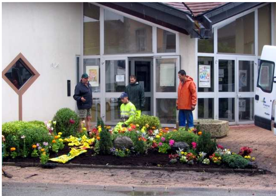
L'entrée de la mairie est ainsi plus avenante