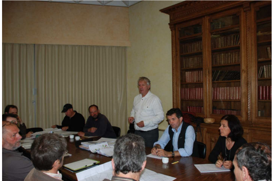
Réunion préalable au démarrage du chantier