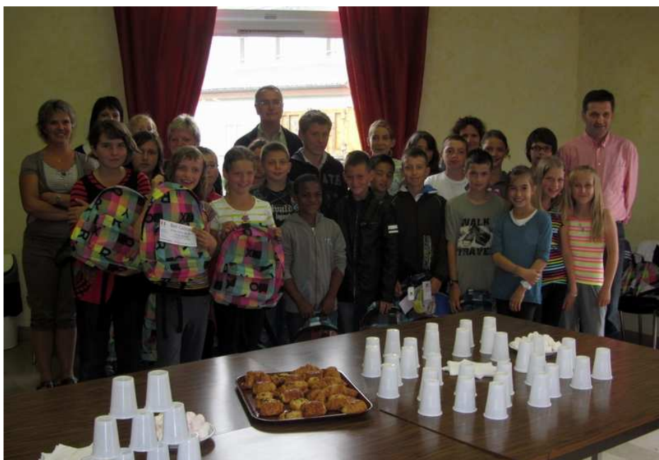
Prêts pour la 6ème !

Après avoir reçu les encouragements d'usage pour leur entrée au collège, les enfants ont pu partager un goûter en compagnie de certains parents venus assister à cette cérémonie.