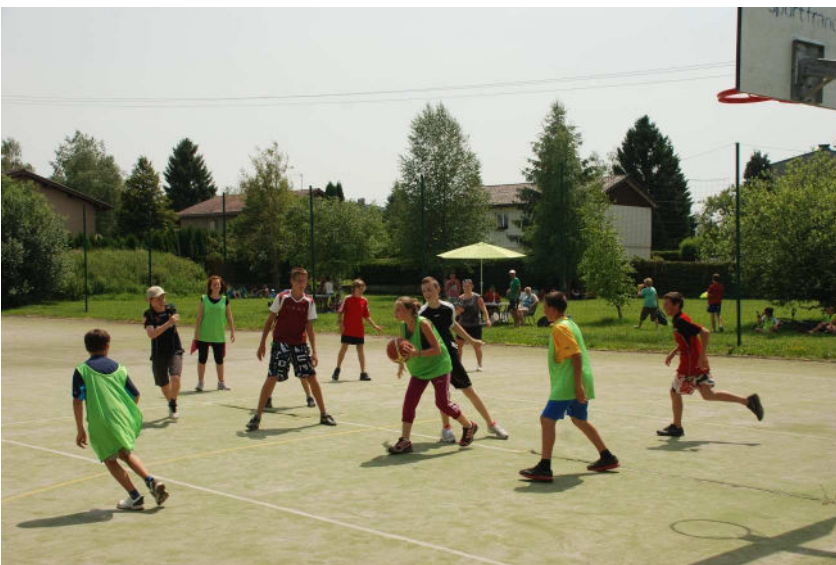
36 jeunes, filles et garçons, de 10 à 15 ans ont participé au tournoi