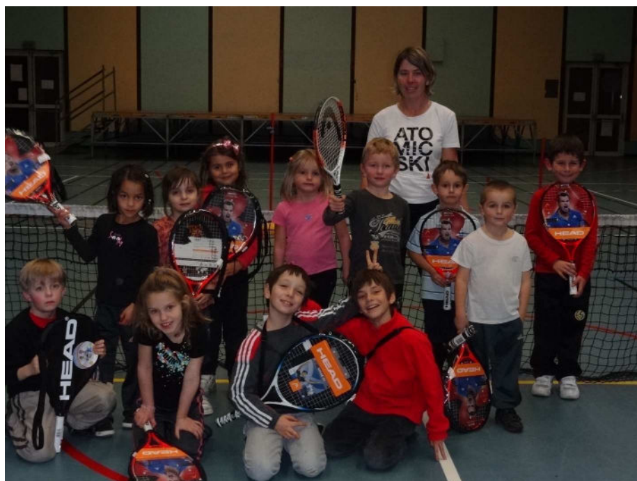
Remise des raquettes aux minitennis offertes par la ligue de Franche-Comté et le conseil régional (comme chaque année).