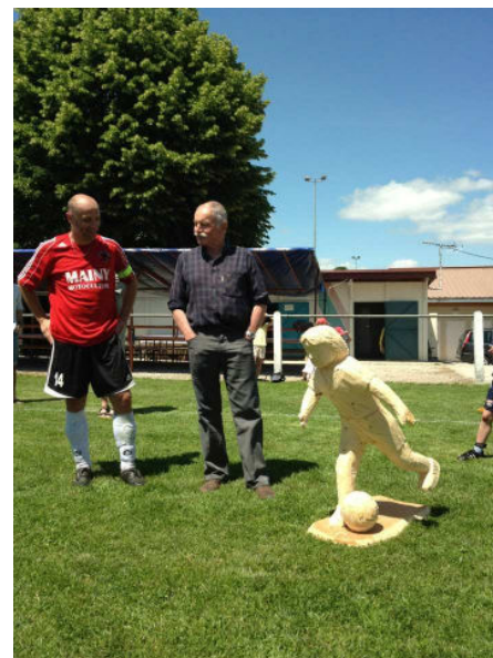
Merci BIBI !!

ans du club à l'occasion du réveillon de la Saint Sylvestre.