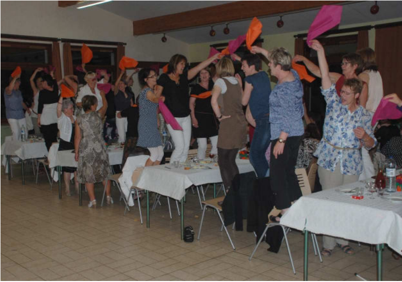
Plus de 130 mamans ont répondu présent à l'invitation de la municipalité