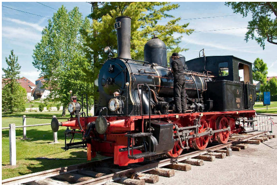
La locomotive a rugi tout le week-end comme à la belle époque.