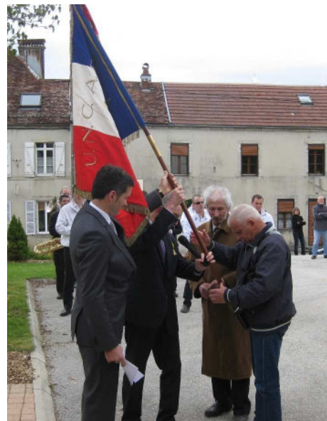
Instant solennel : la passation du drapeau