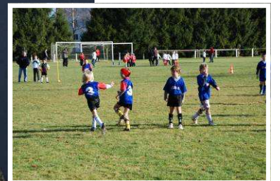
Une vie associative